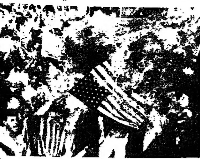
متمشرون اربعون بحرون العلم الاميري

اعان الرئيس اليمني علي عبدالله صالح انه فوجيء في مؤتمر القمة العربية الذي عقد في القاهرة يوم الجمعة وادان الغزو العراقي للكويت، وقرر ارسال قوة عربية لحماية المنطقة العربية السعودية بقرارات مصفاة عمل عليها. وقال صالح في مؤتمر صحفي عقده امس الاول ان الاسباب الرئيسية لما قاله انه فشل القمة العربية، هي انها جاءت بعد التواجد الاجنبي في الاراضي العربية، بالإضافة الى انه لم يسبق انعقاد القمة اي تحضير لحد اجتماع لوزراء الخارجية العرب. واضاف قوله لو كان هناك حكمة لدعي لعقد القمة فور دخول العراق الى الكويت بحيث تطوق المنطقة في محيط الاسرة العربية، ويتم حلها دون اي تأخير اجنبي، ولكن لسفك فوجئنا عند عقد هذه القمة بقرارات مصفاة عمل عليها. وقال صالح ان اليمن التي كانت التصويت على قرارات القمة لانه كانت لديه مقترحات تركت حول سحب القوات والامم المتحدة من المنطقة الخليجية، وانسحب القوات العراقية من الكويت، وان تدخل دول الخليج العربية او فوجئنا فوجئنا عند عقد هذه القمة بقرارات مصفاة عمل عليها. وقال صالح ان اليمن التي كانت التصويت على قرارات القمة لانه كانت لديه مقترحات تركت حول سحب القوات والامم المتحدة من المنطقة الخليجية، وانسحب القوات العراقية من الكويت، وان تدخل دول الخليج العربية او فوجئنا فوجئنا عند عقد هذه القمة بقرارات مصفاة عمل عليها.